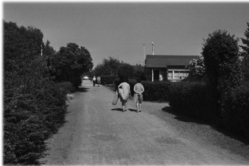
Marjaniemen siirtolapuutarha 1975