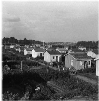
Raholan siirtolapuutarha 1954