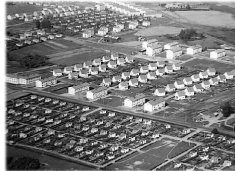
Nekalan siirtolapuutarha 1950-luvulla