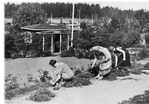
Kumpulan siirtolapuutarha 1930-luvulla