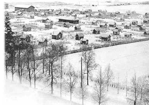
Hatanpään siirtolapuutarha 1930-luvulla