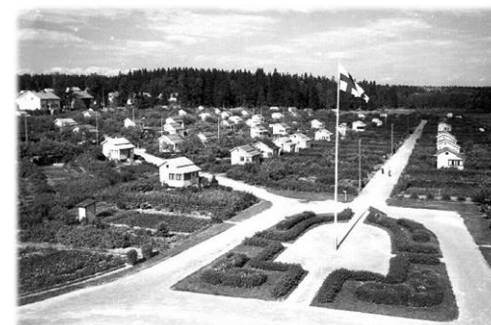
Litukan siirtolapuutarha 1955